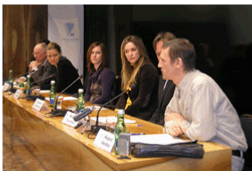
Bildimpression/photo: AutorInnen am Podium des Pressefrühstücks