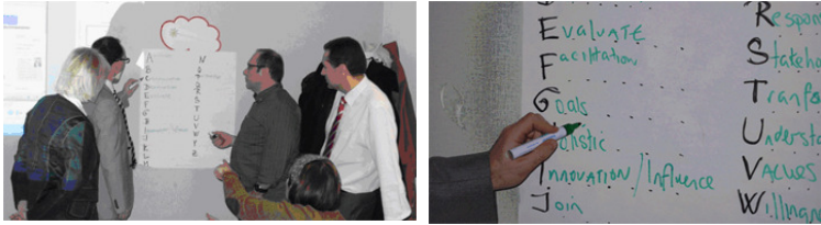
Bildimpression/photo: 7th COP Meeting in Brussels

For further information please follow the link http://partnership.esflive.eu